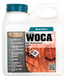
WOCA Ö-Refresher Natur / Weiss