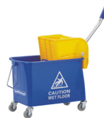
Multimop NG2 Doppel-Fahreimer