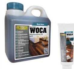
Pflegeöl / -Paste Natur / Weiss