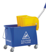
Multimop NG2 Doppel-Fahreimer