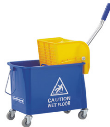
Multimop NG2 Doppel-Fahreimer